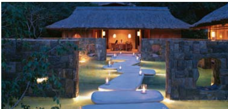
Six Senses Spa