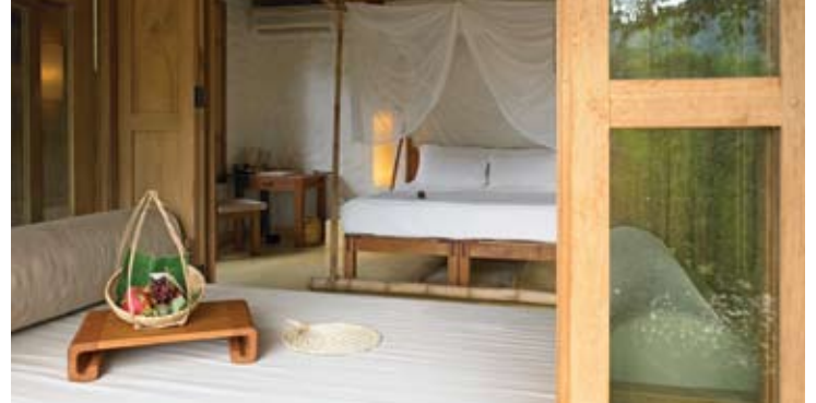
Beach Villa Bedroom