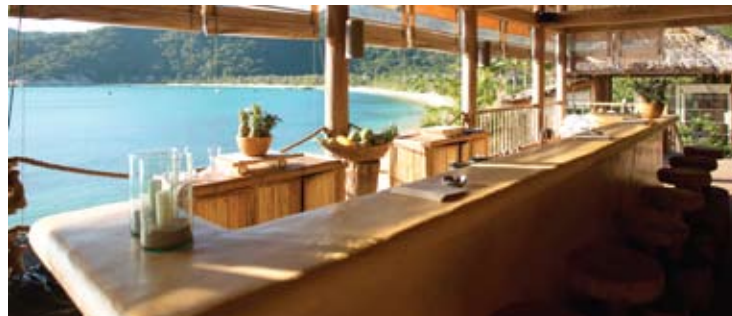
Drinks by the Bay

ダイニング・バイ・ザ・ベイに隣接するドリンクス・バイ・ザ・ベイでは夕日を眺めながら、ディナーの前の食前酒をどうぞ。また、ディナーを堪能した後、くつろぎの場所としても人気です。バーは最後のお客様がお帰りになるまで営業いたします。