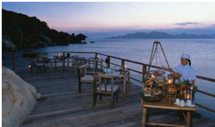
Dining by the Bay

このレストランでは、ディナーにインターナショナル・フュージョン料理と地元料理を、朝食にはアジア料理から西洋料理、新鮮なトロピカルフルーツまで、幅広いメニューを取り揃えたビュッフェをお召し上がりいただけます。当レストランは2階に分かれており、頬をなでる潮風に吹かれながら、入り江を見渡すことができます。階下には竹でできた天井があり、くつろいだ雰囲気を感じ出す一方、上階は高い天井と藁葺き屋根があり、屋外で食事をするような体験をお楽しみいただけます。